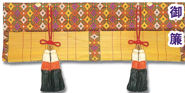
大和錦縁 (麻房・金具付き)